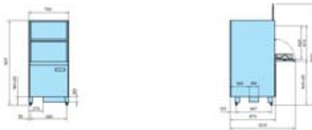
GS 640 Energy