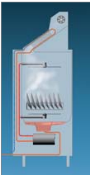
Schematische weergave van het warmteterugwinningsproces van de GS 640 Energy (alleen bij koudwateraansluiting mogelijk)