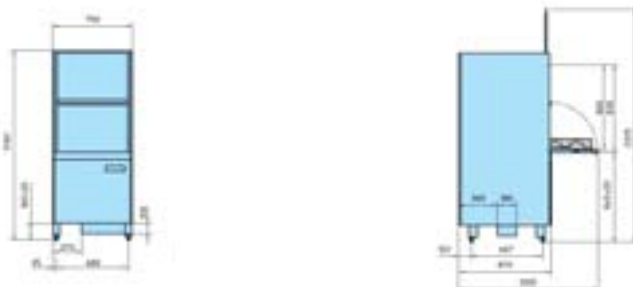
GS 650 Energy